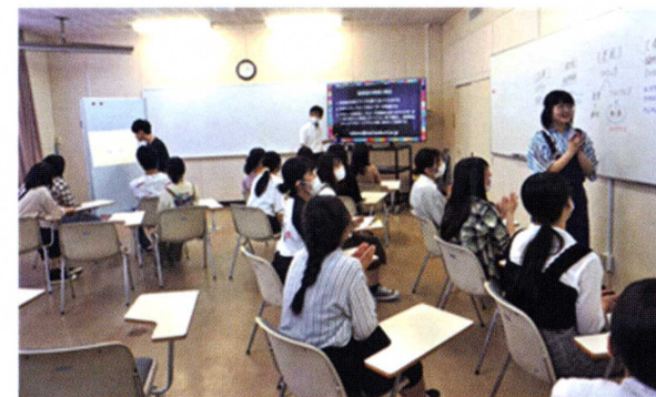
ICT化の進んだAL (アクティブラーニング) 演習室 (岩国短期大学)

また、目途指定のご寄付によって短大・高校事務室にパソコン、プリンターを整備致しました。