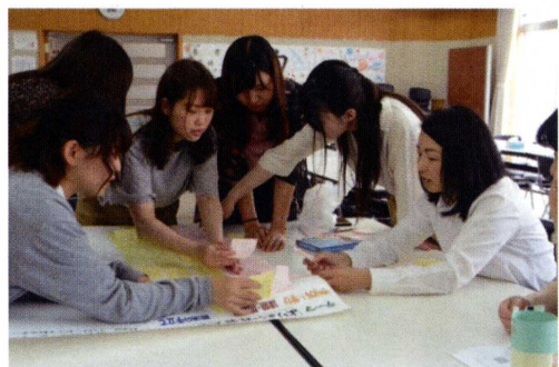
卒業生対象フォローアップセミナー