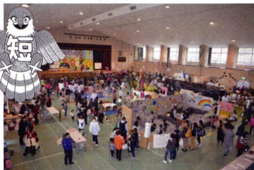
第8回 Iwatan 親子フェスタ(1600 名来場)

地域に愛され信頼される短期大学の構築のため、教職員も学生も地域社会の一員として、建学の精神「楽学」、教育理念「地域に生きて働く人材の養成」の実現に邁進して参ります。