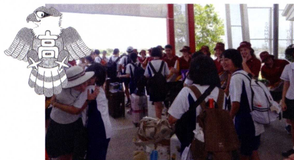
オーストラリア 姉妹校 (サザンクロス校) 訪問

AI化やグローバル化、少子高齢化が急進する21世紀においても、「徳性の陶冶」によって子どもたちのたくましく生き抜く力を培い、社会に送り出すことを使命に、教職員一丸となって取り組んで参ります。